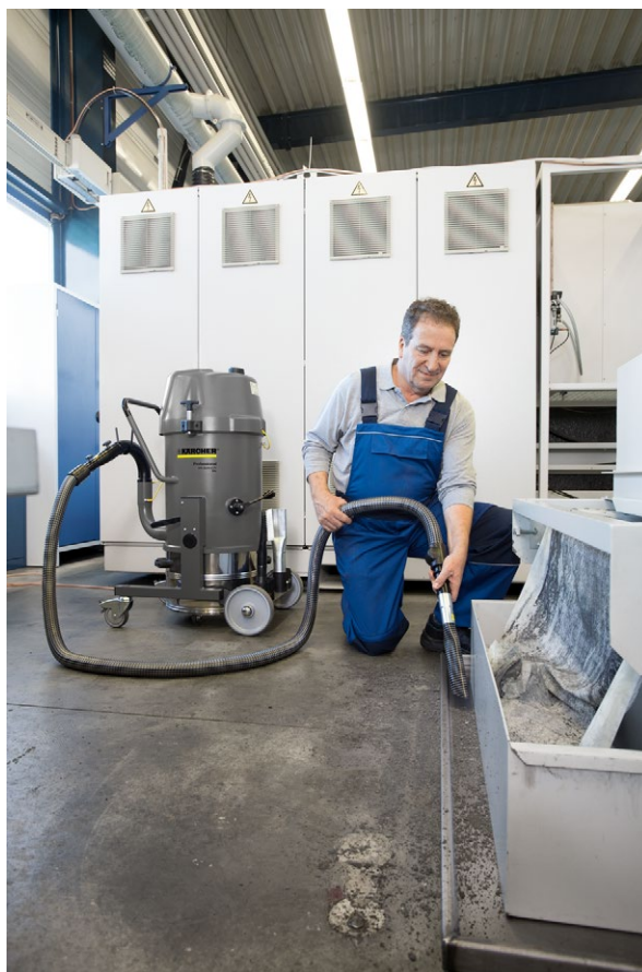
IVR 35/20-2 Sc Me