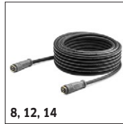
8, 12, 14