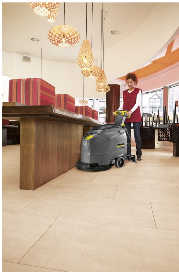
BD 43/25 C Bp Pack