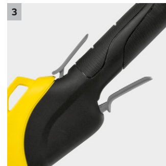
3 Stufenlose Geschwindigkeitsregulierung