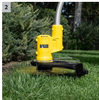
2 Effizientes Schneidsystem