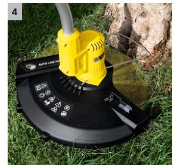
4 Praktischer Pflanzenschutzbügel