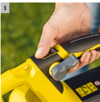
1 Turbo Boost