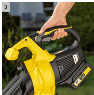
2 Variable Drehzahlregulierung