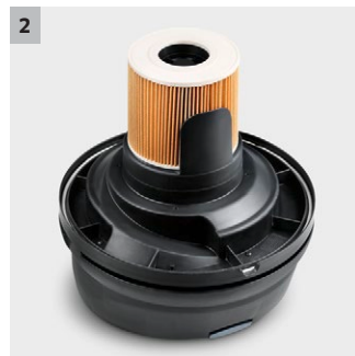
2 Patronenfilter mit Schwimmer