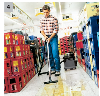
4 Robuster Bumper