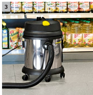
3 Robuster Bumper